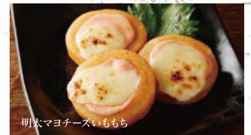
明太マヨチーズいももち