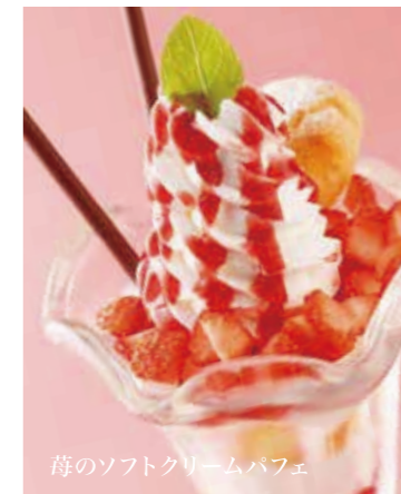
苺のソフトクリームパフェ