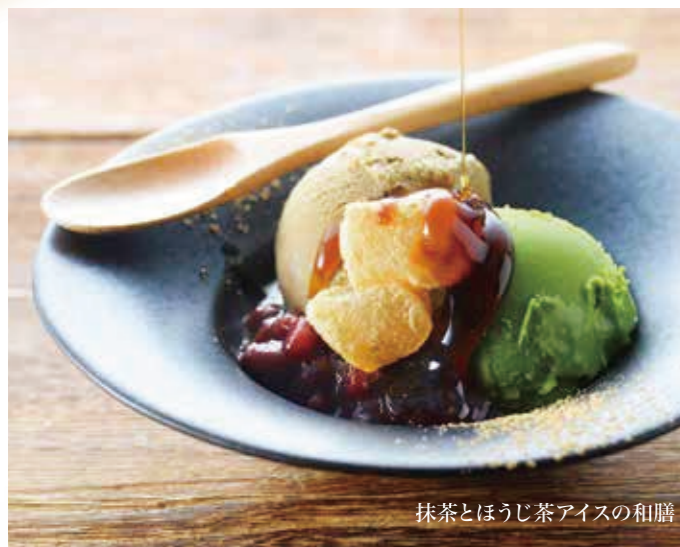
抹茶とほうじ茶アイスの和膳