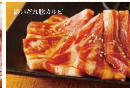
濃いだれ豚カルビ