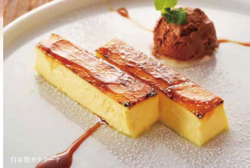
自家製カタラーナ