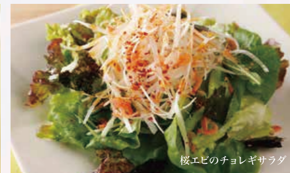
桜エビのチョレギサラダ