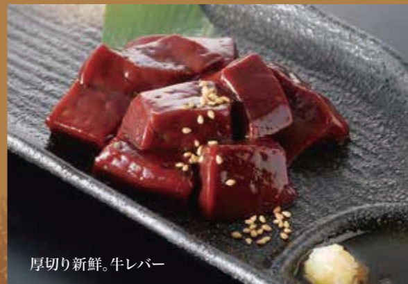
厚切り新鮮。牛レバー