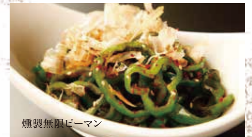
燻製無限ピーマン