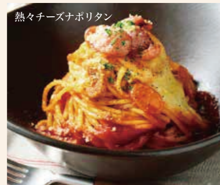
熱々チーズナポリタン