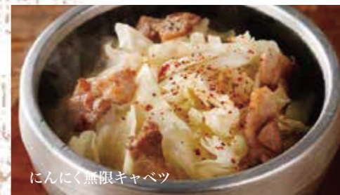
にんにく無限キャベツ