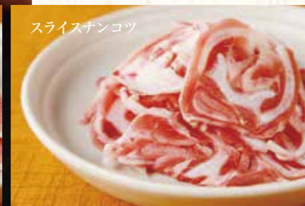
スライスナンコツ