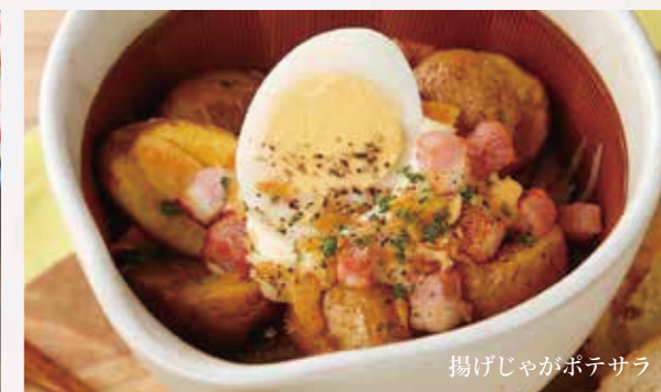
揚げじゃがポテサラ