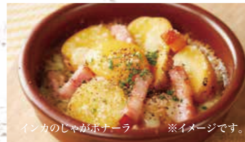
インカのじゃがポナーラ ※イメージです。