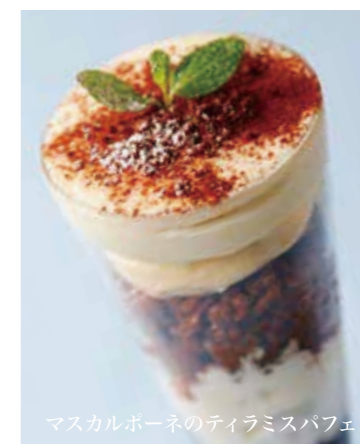
マスカルポーネのティラミスパフェ