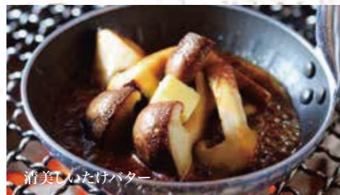
清美しいたけバター