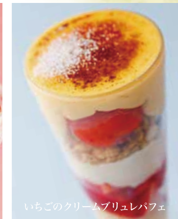
いちごのクリームブリュレパフェ