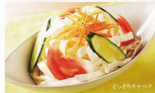
どっさりキャベツ