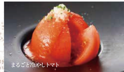
まるごと冷やしトマト