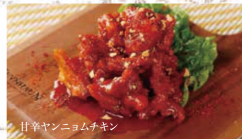
甘辛ヤンニョムチキン