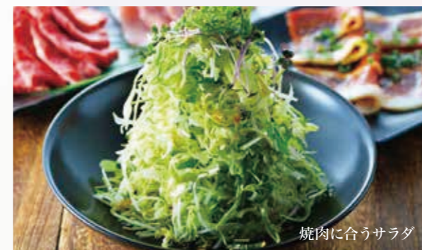
焼肉に合うサラダ