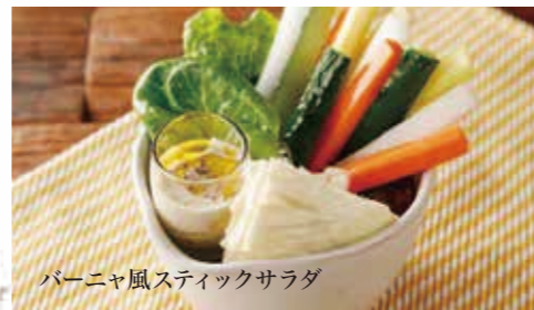
バーニャ風スティックサラダ