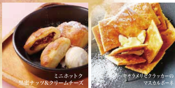
ミニホットク 黒蜜ナッツ&クリームチーズ