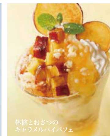
林檎とおさつの キャラメルパイパフェ