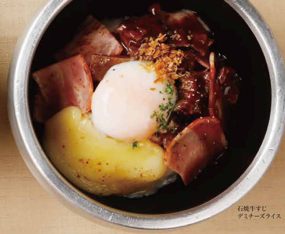
石焼牛すじ デミチーズライス