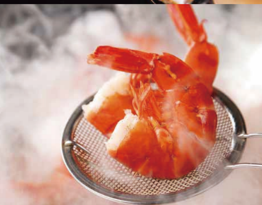
オーシャンボイル